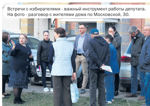
Встречи с избирателями - важный инструмент работы депутата. На фото - разговор с жителями дома по Московской, 30.