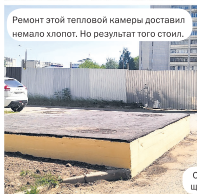
Ремонт этой тепловой камеры доставил немало хлопот. Но результат того стоил.