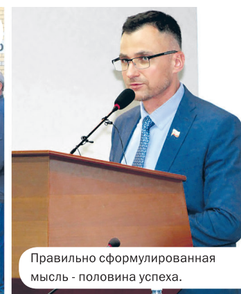
Правильно сформулированная мысль - половина успеха.