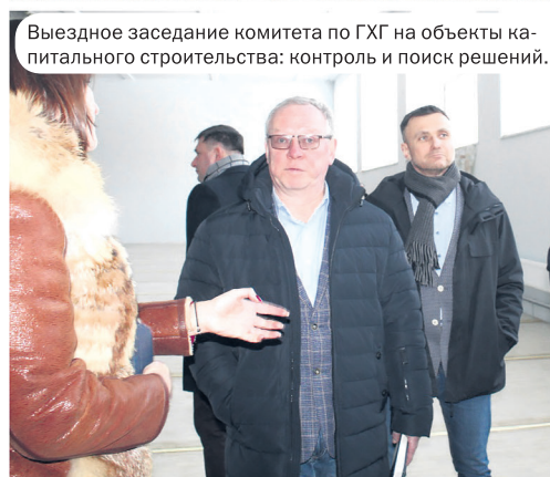
Выездное заседание комитета по ХГГ на объекты капитального строительства: контроль и поиск решений.