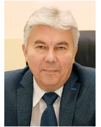
Александр ТИХОНОВ, глава г. Сарова Нижегородской области

Город Саров давно привык к своему особому статусу. Недавно он приобрёл ещё один статус, который может вывести его в лидеры не только ядерной физики, но и вполне гражданской экономики: впервые в истории России закрытый город стал территорией особого социально-экономического развития.